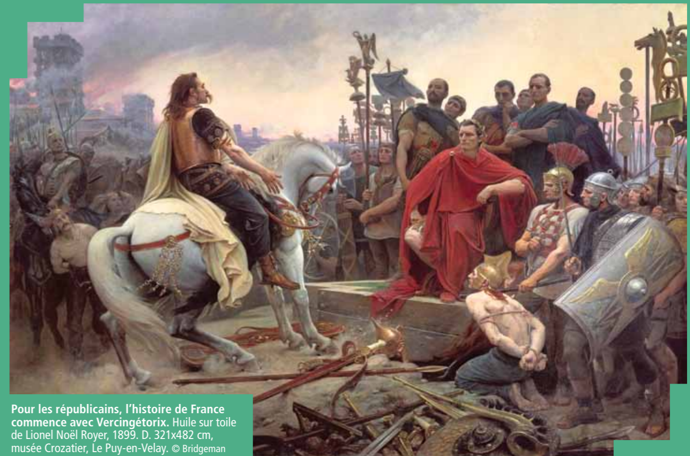
Pour les républicains, l'histoire de France commence avec Vercingétorix. Huile sur toile de Lionel Noël Royer, 1899. D. 321x482 cm, musée Crozatier, Le Puy-en-Velay.

l'Église ». Inversement les républicains vénèrent le chef gaulois et le métamorphosent en premier héros national parce qu'ils saluent en lui une figure de proue païenne, dont la promotion à la tête des contingents arvernes représente une esquisse d'élection démocratique. Chez les auteurs laïques, Vercingétorix devient ainsi, par sa résistance à la conquête de César, une sorte de préfiguration républicaine de Gambetta le héros de la résistance à l'invasion prussienne de 1870. Quant à Clovis, il est décrit, dans les manuels laïques comme un soudard sans foi ni loi, qui s'est fait baptiser pour des raisons purement politiques, et dont la conversion opportuniste ne l'a pas empêché de trucher sans pitié tous les chefs francs qui lui faisaient de l'ombre. Ce tableau très critique des temps mérovingiens exaspère les catholiques. En tout cas, ce bras de fer manichéen à propos des origines nationales illustre à la perfection la conception de l'histoire que Jules Ferry entend développer dans les écoles primaires du pays qu'il a laïcisées par ses lois votées entre 1880 et 1885. Une conception qu'il résume avec concision devant un jeune républicain très attentif. À Jean Jaurès, député du Tarn, qui n'a pas encore opté pour le socialisme démocratique et qui lui demande de définir en quelques mots son idéal politique, Jules Ferry répond : « Organiser l'humanité sans Dieu et sans roi. »