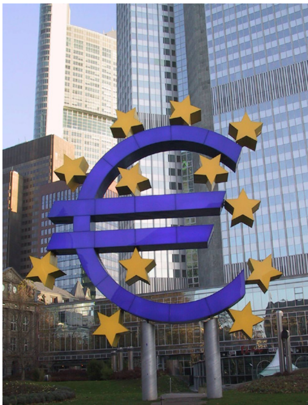
Siège de la BCE à Francfort-sur-le-Main.