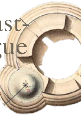
« Projet de paratonnerre sur les tours de La Hougue, îles Tatihou et Saint-Marcouf », signé Simon, 1821, détail (99 x 64 cm, encre et lavis, SHD, 1 er 882, n° 1).