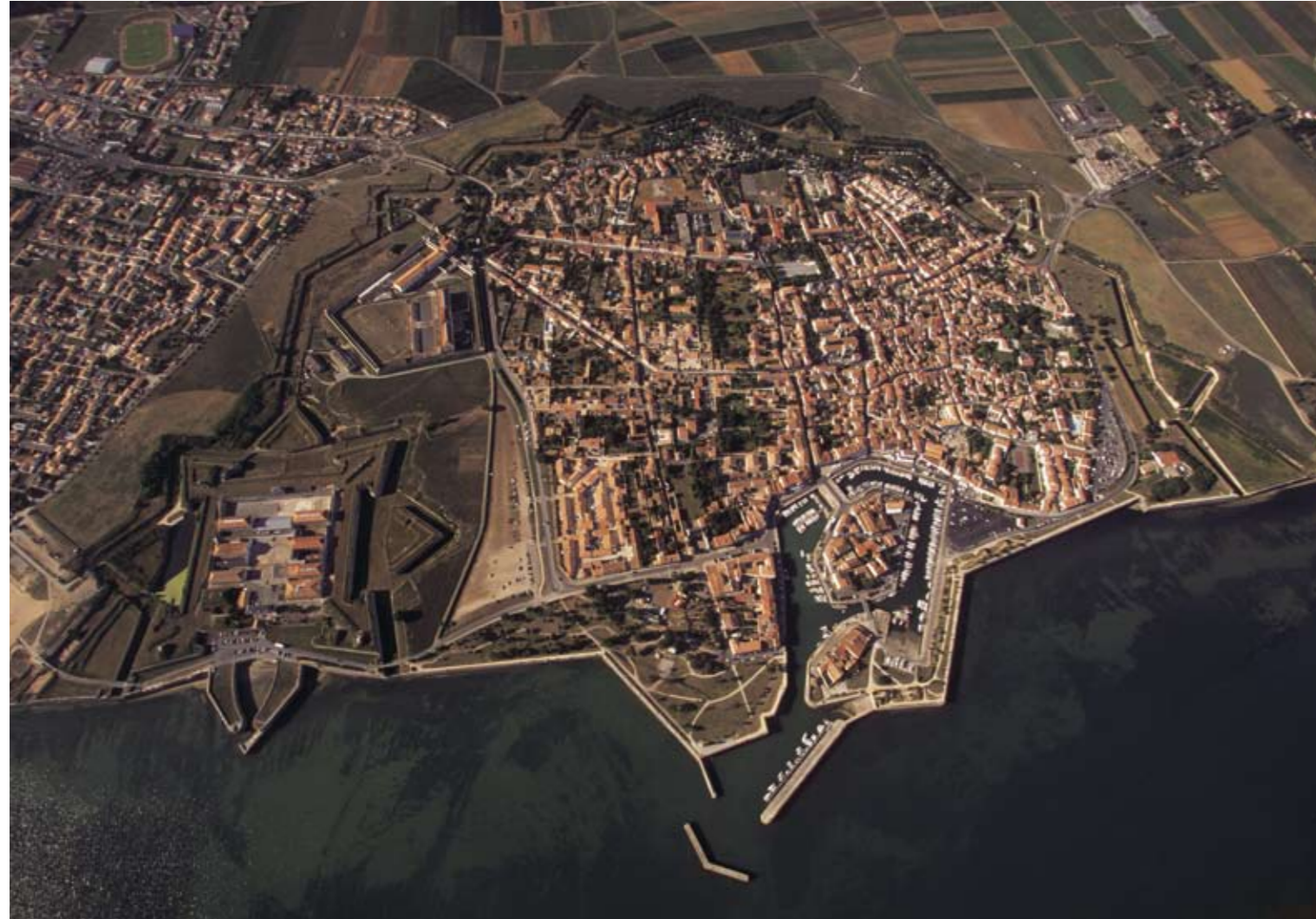
« Plan de la ville, citadelle et de la vue de Saint-Martin en l'isle de Ré », signé Lhuillier, 31 octobre 1728 (58 x 44 cm, encre et lavis, SHD, 1 er 1524, n° 30).