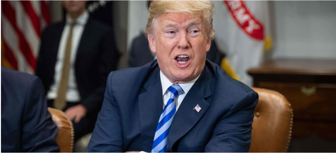
Donald Trump, le 11 mai.

International ( http://premium.lefigaro.fr/international/ ) | Par Jean-Pierre Robin ( #figp-author )