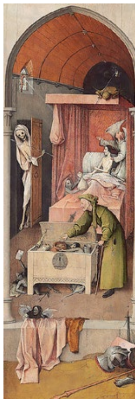
La Mort et l'Avare (1500-1510), Triptyque du vagabond, musée du Louvre (Paris).

Bosch a connu le succès grâce à ses œuvres allégoriques, souvent copiées et largement diffusées, que ses acheteurs se plaisaient à accrocher, ce qui a permis de connaître certains tableaux dont les originaux ont disparu.