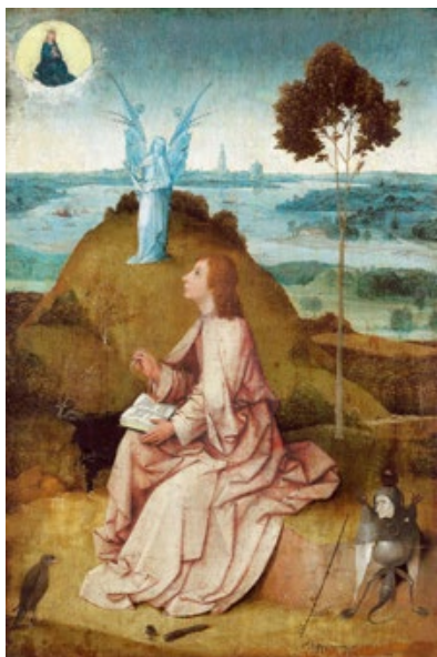
Saint Jean à Patmos (vers 1490), Staatliche Museum (Berlin).

Tout en participant à la mise en scène de pièces de théâtre religieuses pour la confrérie, les mystères, le peintre continue à bâtir son œuvre faite de tableaux, mais aussi de vitraux et même d'esquisses pour la réalisation de chasubles et d'objets liturgiques.