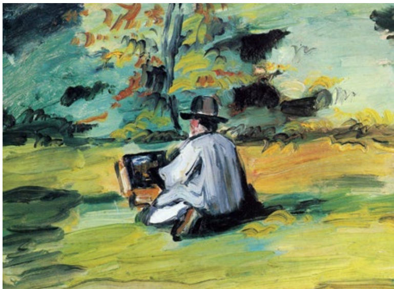
Paul Cézanne, Un peintre au travail (1875), coll. part.

En 1874, cet art officiel est mis à mal par des amateurs d'estampes japonaises, de tubes de peintures et de création au grand air. Pour ces impressionnistes, seule l'apparence des choses est digne d'être peinte. Faire de la toile un reflet de son intériorité? Tollé dans les milieux conservateurs! Obtenir la reconnaissance du public devient un numéro d'équilibriste: il faut à la fois être ami des critiques, séduire les marchands et faire preuve d'indépendance. À ce jeu-là, la marinière de Picasso et les moustaches de Dali vont se révéler d'une efficacité diabolique.