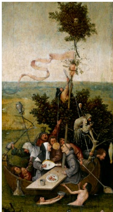
La Nef des fous (1500-1510), Triptyque du vagabond , musée du Louvre (Paris).

Au vu du nombre de scènes aberrantes qui peuplent les œuvres de Bosch, on peut dire que le peintre, à sa manière, a lui aussi témoigné du malaise et des questions sur la nature humaine qui traversaient son époque.