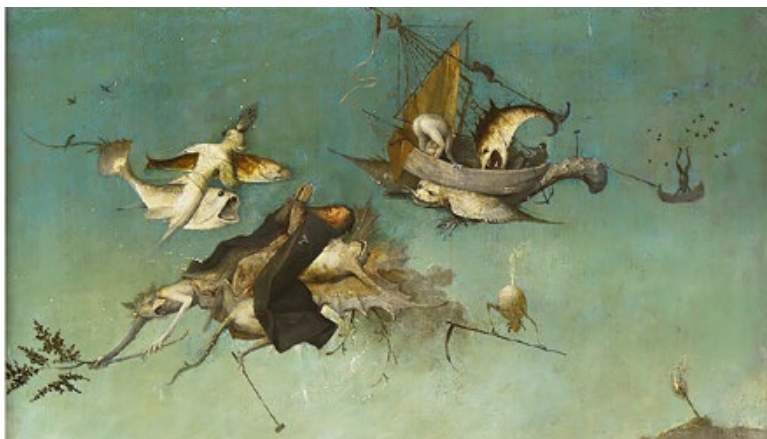
La Tentation de saint Antoine (v. 1501), Museu Nacional de Arte Antiga (Lisbonne).

Après une vie sans remous, Bosch s'éteint à Bois-le-Duc vers 1516. Sur le registre de décès, à côté de son nom est mentionné insignis pictor (« peintre célèbre »). Sa gloire naissante est déjà à l'œuvre. Elle lui fera traverser les siècles jusqu'à nous.