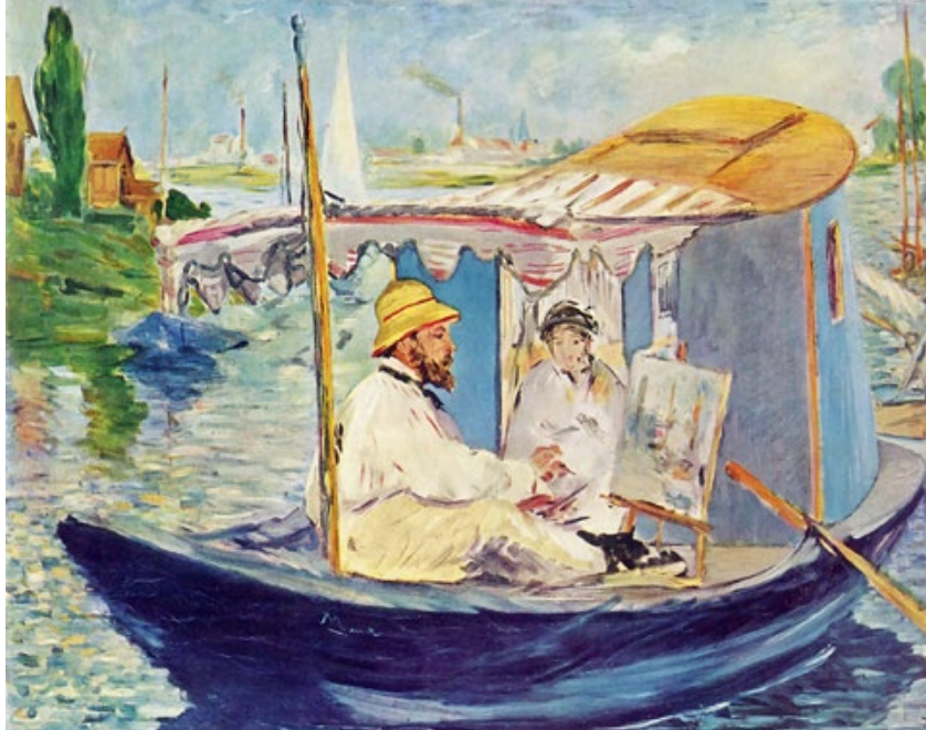
Édouard Manet, Claude Monet peignant dans son atelier (1874), Nouvelle Pinacothèque (Munich).

du fameux « chef-d'œuvre ». Ceux qui veulent gagner leur indépendance vont en Italie, comme Nicolas Poussin qui sera prié de revenir par Richelieu lui-même : « Revenez gaiement, et [je vous assure] que vous trouverez ici plus de contentement que vous ne vous en pouvez imaginer » ! Le « cher et bien-aimé » peintre céda aux sirènes cardinales avant de fuir à nouveau. Il faut dire que ce n'est qu'en mars 1648 que s'ouvre enfin à Paris l'Académie de peinture, apportant honneurs et pensions aux artistes de talent.