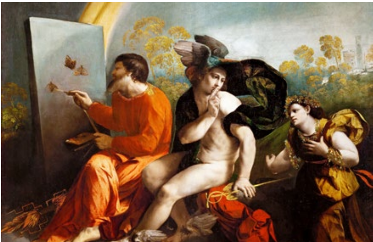
Dosso Dossi, Jupiter, Mercure et Vertu (1524). château royal de Wawel (Cracovie).

En France, l'émancipation est plus tardive. Jusqu'à la fin du XVI e siècle, nos peintres sont obligés d'intégrer une corporation de métier et de suivre un long apprentissage jusqu'à la création