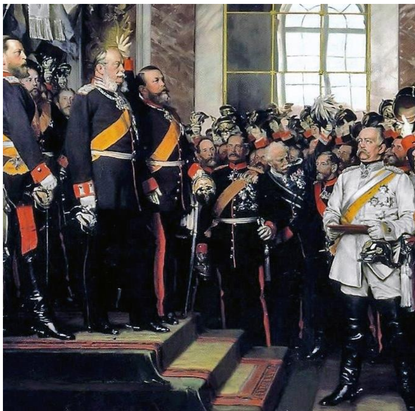
Proclamation de l'Empire allemand le 18 janvier 1871 (Huile sur toile, 250x250 cm, 1885, Anton von Werner, Musée Bismarck, Friedrichsruh, nord-est de l'Allemagne).