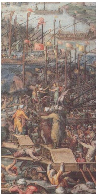
La bataille de Lépante (1571).

La grande Histoire sera au rendez-vous avec le 450 e anniversaire de la bataille de Lépante, un souvenir que voudrait effacer Erdogan.