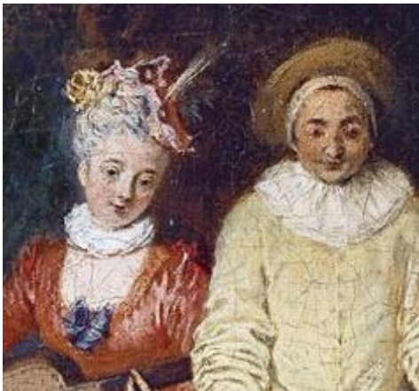
Pierrot content (Antoine Watteau, 1684-1721).

Enfin libérés du poids de la pandémie - du moins nous le croyons -, nous pourrions nous replonger avec le sourire dans les fables de notre cher La Fontaine, né il y a 400 ans. Et nous poursuivrons à l'automne avec les rengaines de Brassens, né il y a 100 ans, mort il y a 40 ans.