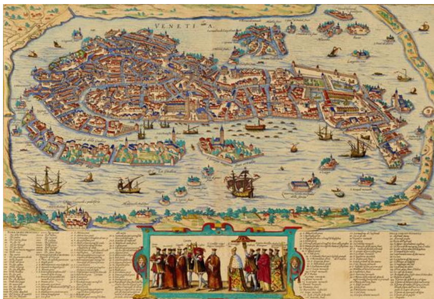
Plan de Venise , par Georg Braun et Franz Hogenberg, publié en 1572, probablement gravé par Bolognino Zaltieri en 1565, Paris, BnF Gallica.