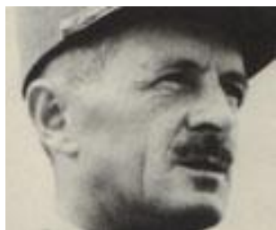
Philippe Leclerc de Hauteclocque.

Le colonel Leclerc enlève aux Italiens l'oasis de Koufra, au sud de la Libye.